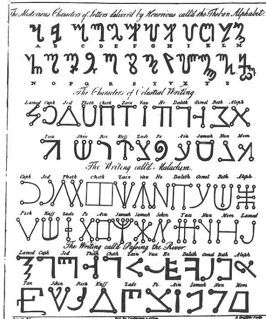
Das Thebanische Alphabet in Francis Barretts The Magus (1801).

ISO/IEC 10646. 26. Februar 2002, abgerufen am 15. Mai 2015.