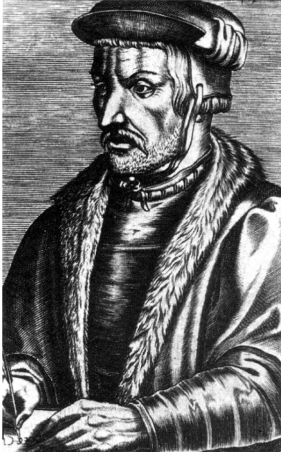
Agrippa von Nettesheim